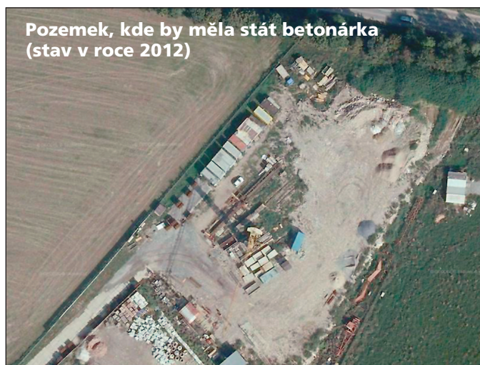
Pozemek, kde by měla stát betonárka (stav v roce 2012)

■ ano Jesenice nesouhlasí, ale Modletice ani Herinka nemají námitek (uvedená usnesení se netýká stávajícího umístění). Skutečně jsou proti Čestlice a pro probavení důvod: zvýšení dopravy a hluku v Čestlicích – požadují proto protihlukovou stěnu (!!!). U nich však všichni víme, o co ve skutečnosti