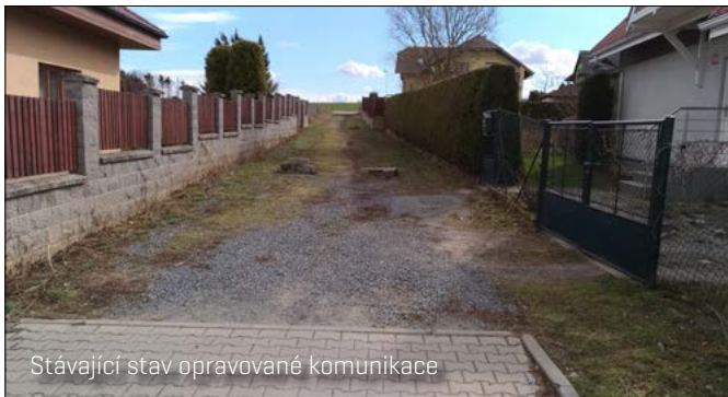
Stávající stav opravované komunikace