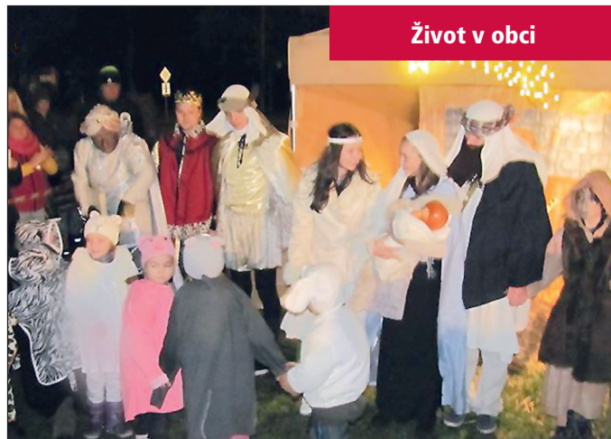
Život v obci