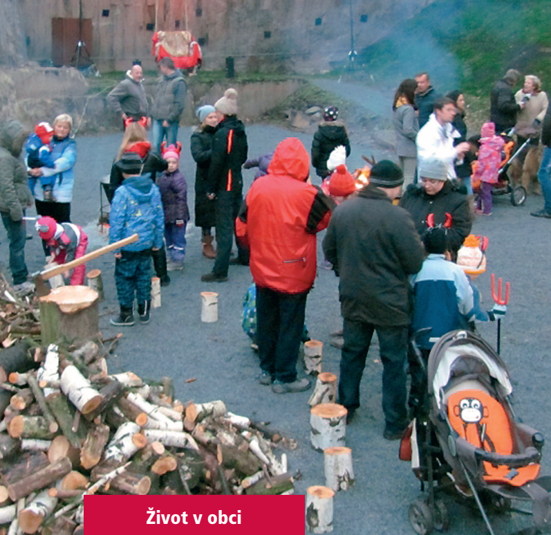
Život v obci