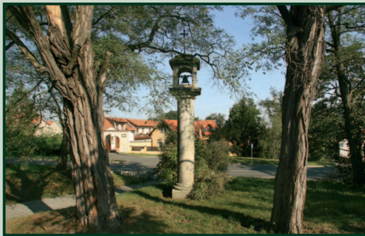
Průhonice, náměstí V Holi Průhonice, The "V Holi" ring