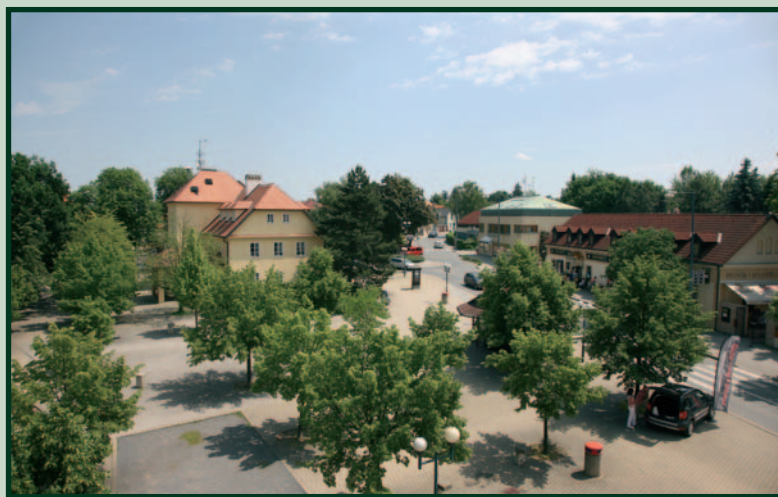
Průhonice, Květnové náměstí

Dendrologická zahrada , spravovaná Výzkumným ústavem Silva Taroucy pro krajinu a okrasné zahradnictví, v.v.i., byla založena v polovině sedmdesátých let minulého století na ploše 73 hektarů. Je zde soustředěno asi 5000 taxonů dřevin a trvalek, čímž se řadí mezi největší sbírky okrasných rostlin na území České republiky. Jedinečné je členění zahrady, při kterém je kladen velký důraz na použití jednotlivých skupin rostlin v sadovnických úpravách. Plní důležitou roli v rámci osvěty veřejnosti, slouží jako zdroj inspirace a poznání a je významným rekreačním objektem v těsném sousedství Prahy. Aktuální informace: www.dendrologickazahrada.cz .