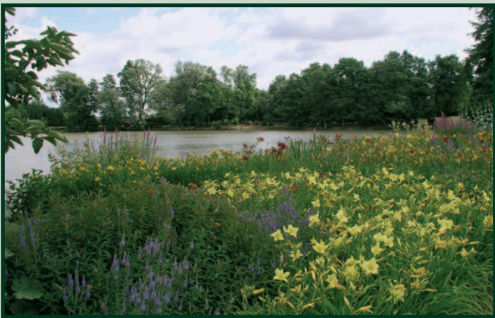
Dendrologická zahrada The Dendrological Garden